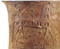
Le héros grec Ulysse et le cheval de Troie