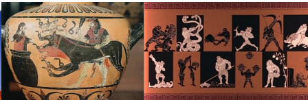
Héraclès-Hercule et les douze travaux : le demi-dieu et Cerbère, le chien des Enfers